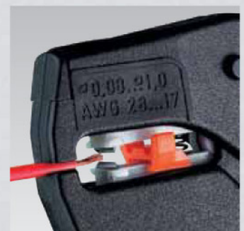
Selbsttätiges Anpassen auf Leiterquerschnitte von 0,08 - 1,0 mm 2