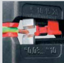
Präzises Abisolieren ohne Beschädigung des Leiters