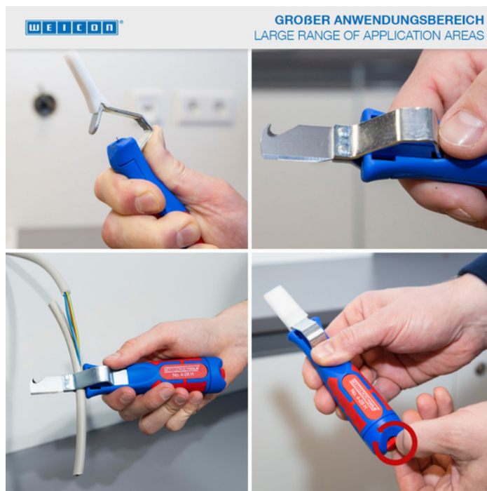
GROBER ANWENDBEREICH LARGE RANGE OF APPLICATION AREAS

Das Kabelmesser 4-28 H ermöglicht ein präzises, schnelles und sicheres Abmanteln aller gängigen Rundkabel mit einem Durchmesser zwischen 4 und 28 Millimeter. Das Kabelmesser verfügt über einen ergonomisch geformten, rutschfesten Mehrkomponenten-Griff. Mit Hilfe einer Stellschraube am Griffende kann die Schnitttiefe des Schneidmessers stufenlos reguliert werden. Dies verhindert eine Beschädigung der inneren Leiter. Das Schneidmesser ist selbstdrehend im Gehäuse integriert und ermöglicht so die automatische Umstellung von Rund- auf Längsschnitt. Zusätzlich verfügt das 4-28 H über eine Hakenklinge, die mit einer Schutzkappe versehen werden kann. Diese Kappe rastet sicher auf der Klinge ein, was die Verletzungsgefahr deutlich reduziert.