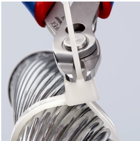
zum bündigen Schneiden, z. B. zum Einkürzen von Kabelbindern

Technische Änderungen und Irrtümer vorbehalten