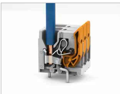
Eindrähtige Leiter anschließen – direkt stecken.