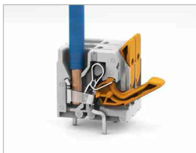
Feindrähtige Leiter anschließen und alle Leiter mit Hebel lösen.