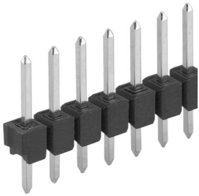
Leiterkartensteckverbinder>Stiftleisten Einreihig, □ 0,635 mm