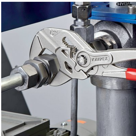
ersetzt einen Satz Schraubenschlüssel, metrisch wie zöllig