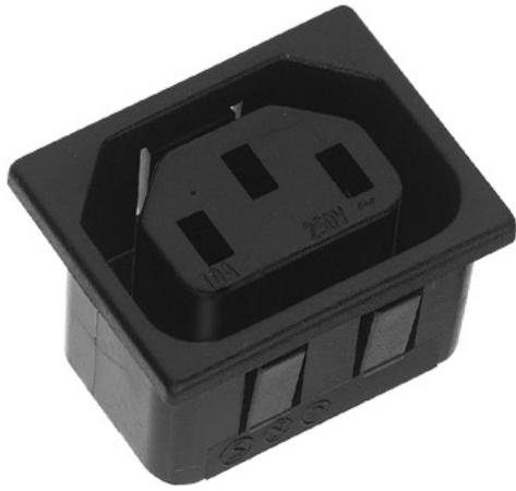
Einbau - Gerätesteckdose, Steckflansch. Alte K+B Serie 704