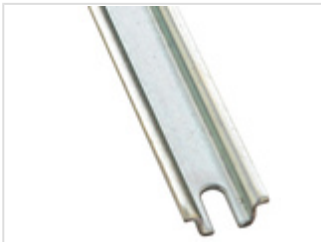
Tragschienen DIN EN 60715 TH 15